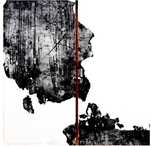
Anne PAULUS, Archipel Fragmentaire XXV, eau forte, 2015, 40 x 40 cm