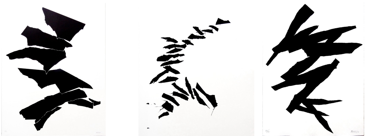
Alicia PENALBA, sérigraphie, 1977, 80 x 60 cm