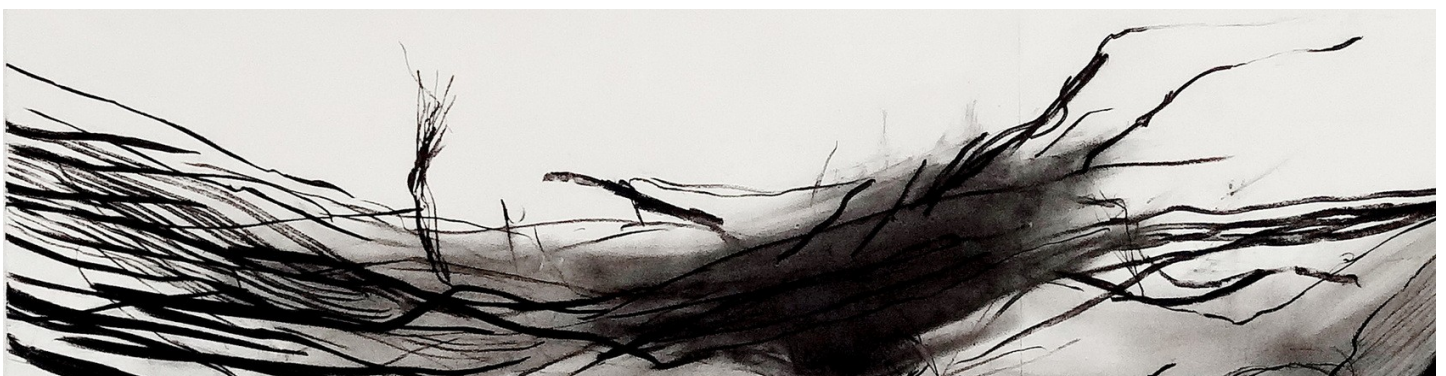
Jean-François BAUDÉ, fusain, 160 cm (détail)

Nous sommes amoureux des papiers et des encres, des pigments, des outils.