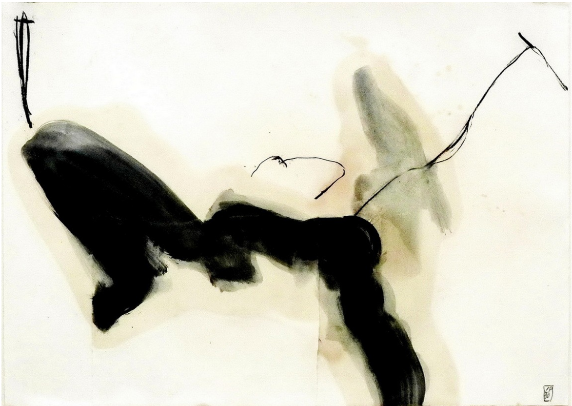
Claude PANIER, Tanztheater, Technique Mixte, huile, 1990, 50 x 65 cm

COLLECTIONNER, C'EST, POUR NOUS, CHOISIR ENSEMBLE.