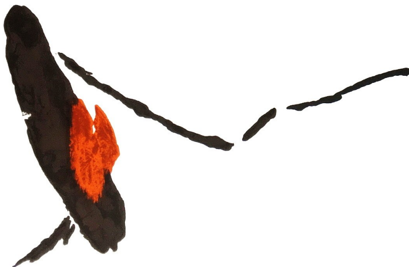
Pierre TAL COAT, Dialogue, 1972, lithographie, 38 x 56 cm

D'autres tâches s'ajoutent comme la gestion du site internet, des Facebook, l'organisation des expositions.