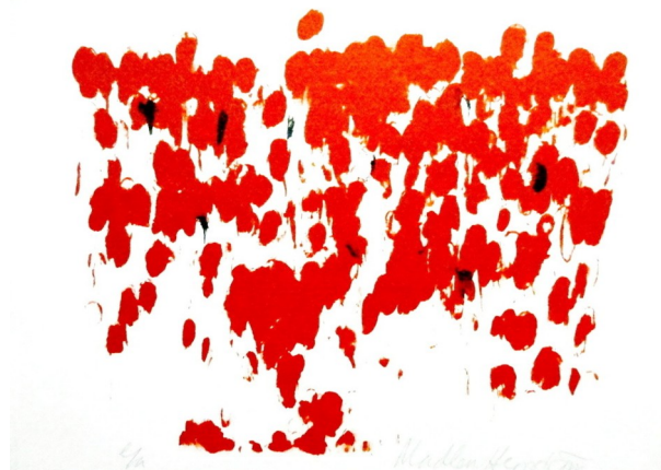
Madlen HERRSRTÖM, Sans Titre, lithographie, 2009, 25 x 28 cm

COMME IL Y A 40 ANS , nous avons plaisir à installer de nouvelles acquisitions dans notre lieu de vie et à les insérer parmi les précédentes, tout en gardant une sensation d'espace . Nous modifions périodiquement l'accrochage pour que notre œil reste surpris.