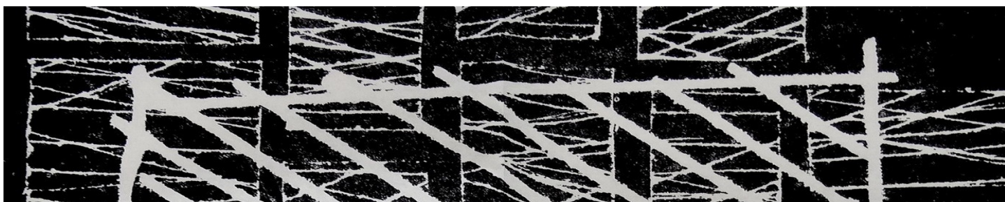
Marc CHARPIN, XY (détail) 2006, xylographie, 60 cm