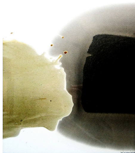
Bernard THIMONNIER, Cire & Huile sur Papier, 2005, 50 x 40 cm