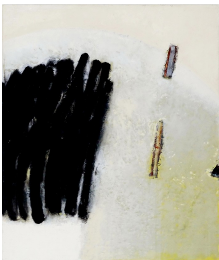
Gianbattista BRESCIANI, n° 390, 2008, acrylique sur toile, 56 x 54 cm.

Certaines œuvres pourraient nous intéresser sur le plan esthétique, mais évoquent des thématiques de confrontations sociales, relationnelles, de dérision...inadaptés pour le lieu paisible de notre maison.