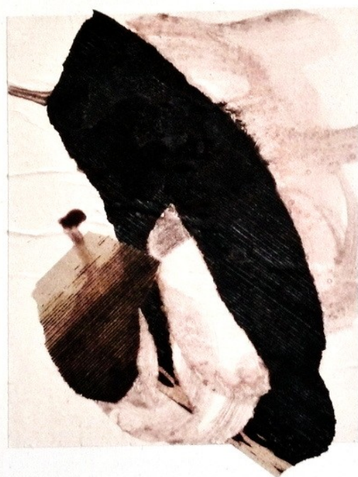
Véronique FLEURY, Technique Mixte collage sur papier marouflé, 1993, 36 x 25 cm

Acquérir, nous permet d'avoir une démarche active dans le monde de l'Art.